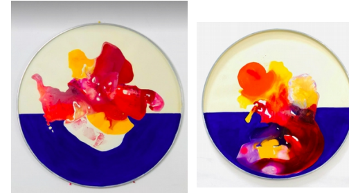
SÉRIE SARDAIGNE CANICULE