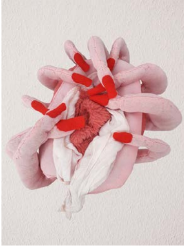
Une tripotée , 2019 7 x 15 x 8 cm Sculpture textile / Tissus, fils, coton, cheveux naturels.