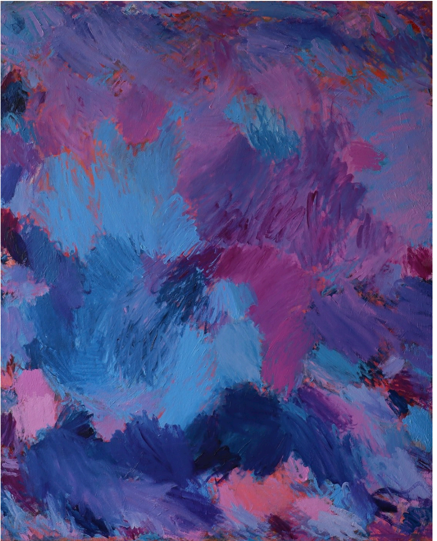
Sans titre , série des Atmosphériques, 2022, 100 x 81 cm Huile sur toile de lin préparé 1250 e