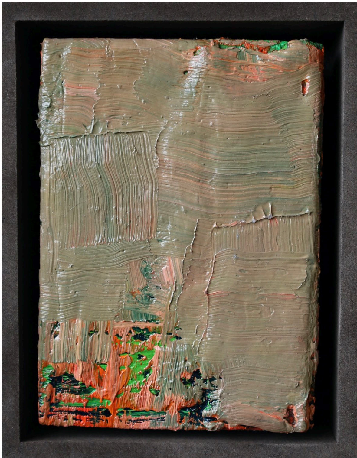
Sans titre , série des Concrétions, 2021-2023 Cadre en médium noir, 16 x 13 cm Huile sur bois de peuplier préparé 300 e