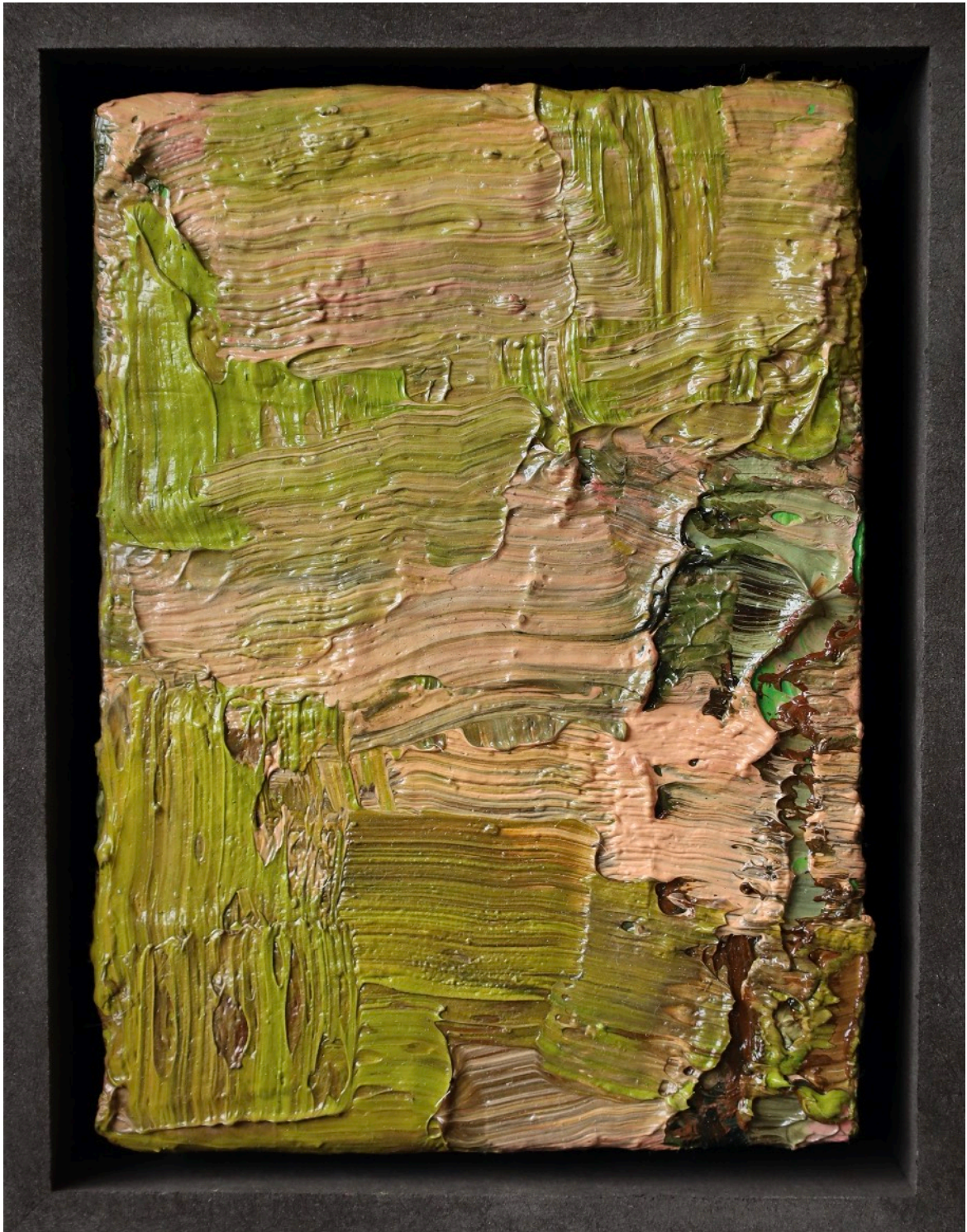
Sans titre , série des Concrétions, 2021-2023 Cadre en médium noir, 16 x 13 cm Huile sur bois de peuplier préparé 300 e