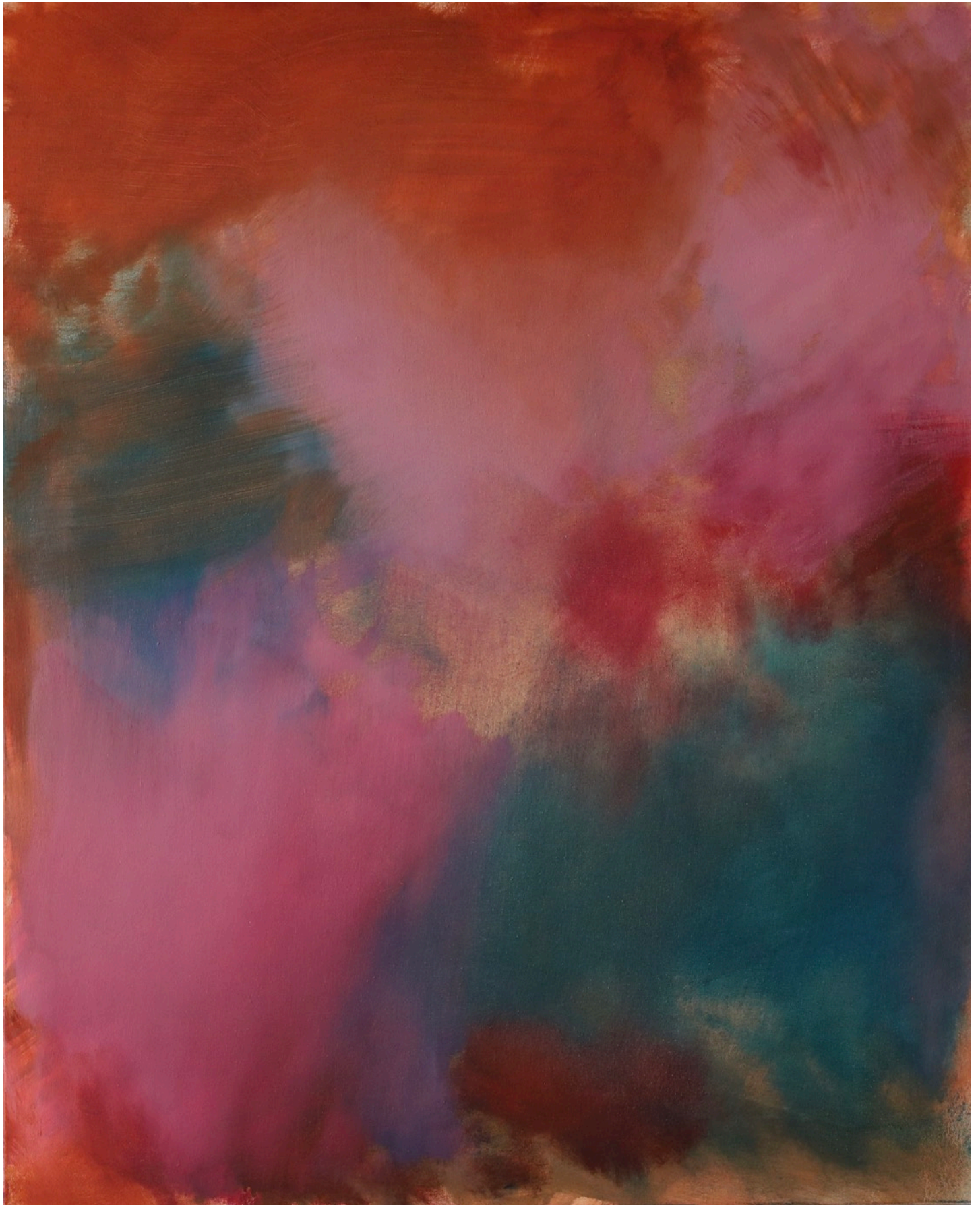
Evanescence , série des Atmosphériques, 2022, 100 x 81 cm Huile sur toile de lin préparé 1250 e