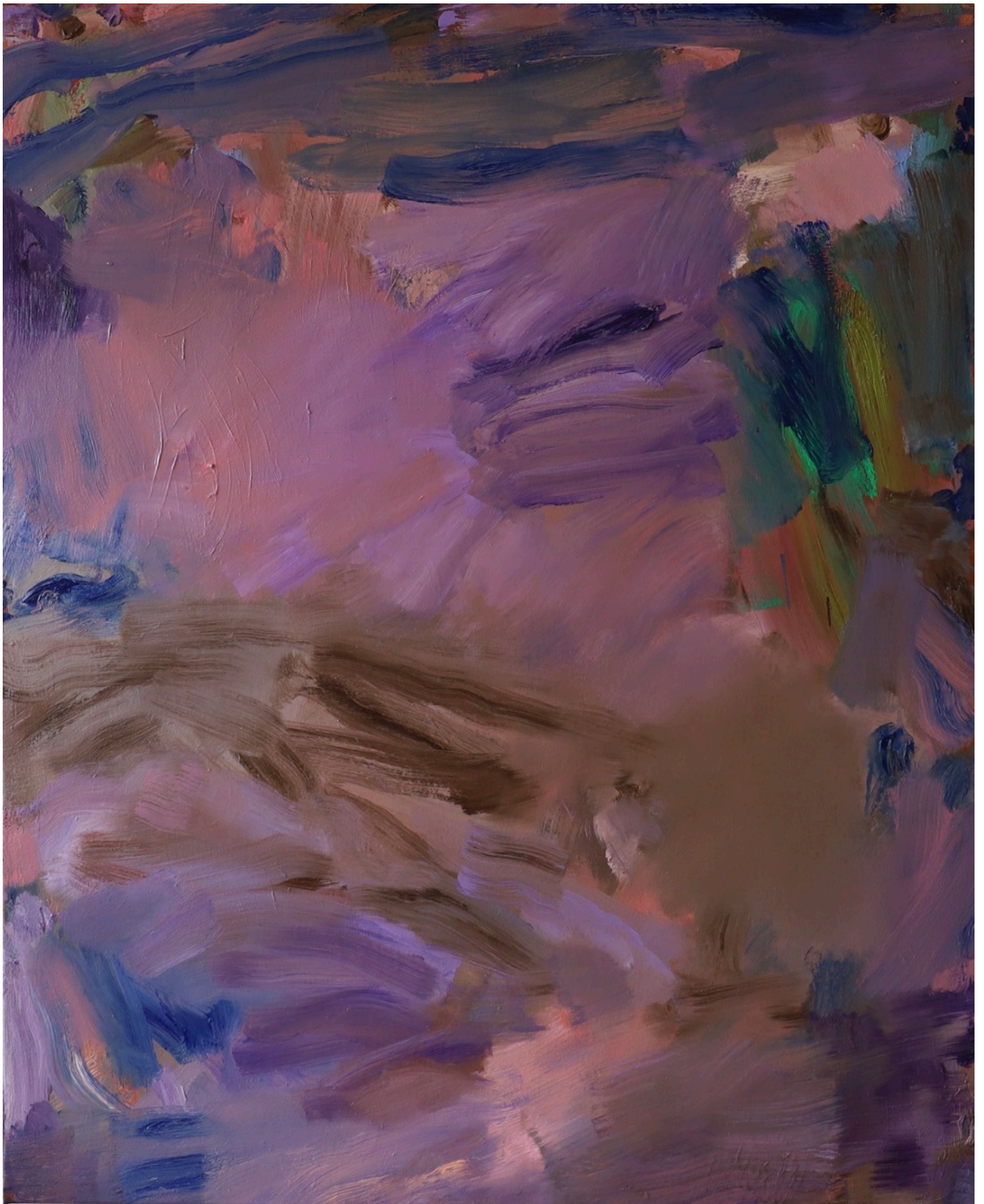
Sans titre , série des Atmosphériques, 2022, 100 x 81 cm Huile sur toile de lin préparé 1250 e