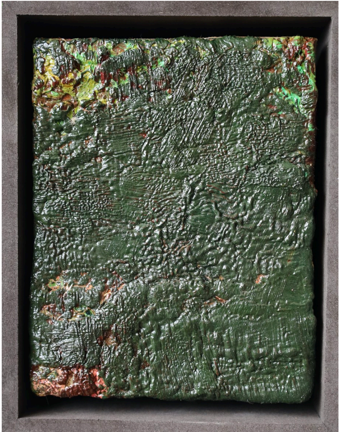
Sans titre , série des Concrétions, 2021-2023 Cadre en médium noir, 16 x 13 cm Huile sur bois de peuplier préparé 300 e