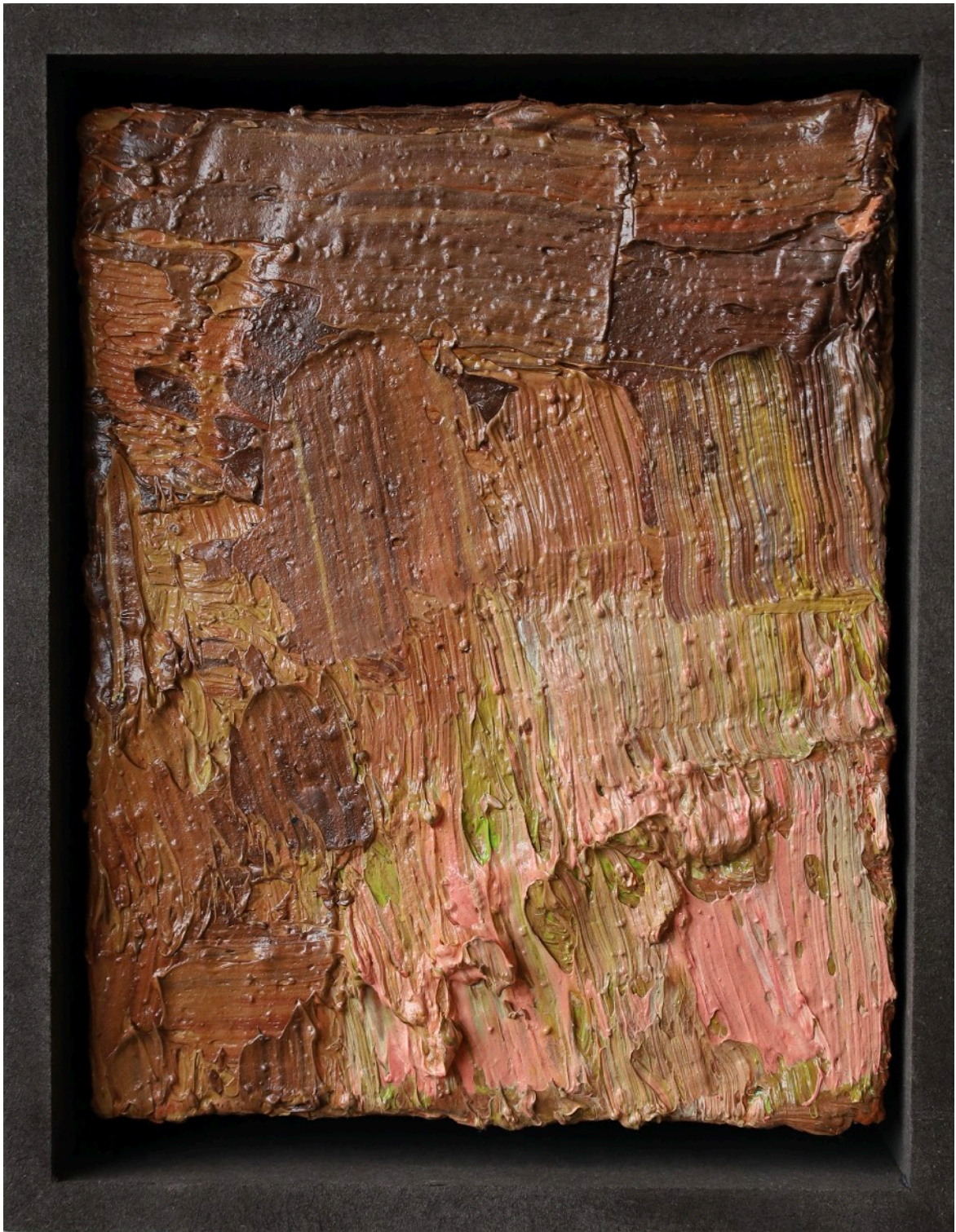
Sans titre , série des Concrétions, 2021-2023 Cadre en médium noir, 16 x 13 cm Huile sur bois de peuplier préparé 300 e