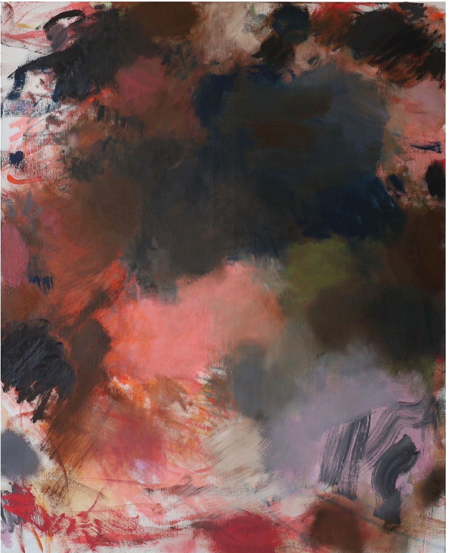
Passage , série des Atmosphériques, 2022, 100 x 81 cm Huile sur toile de lin préparé 1250 e