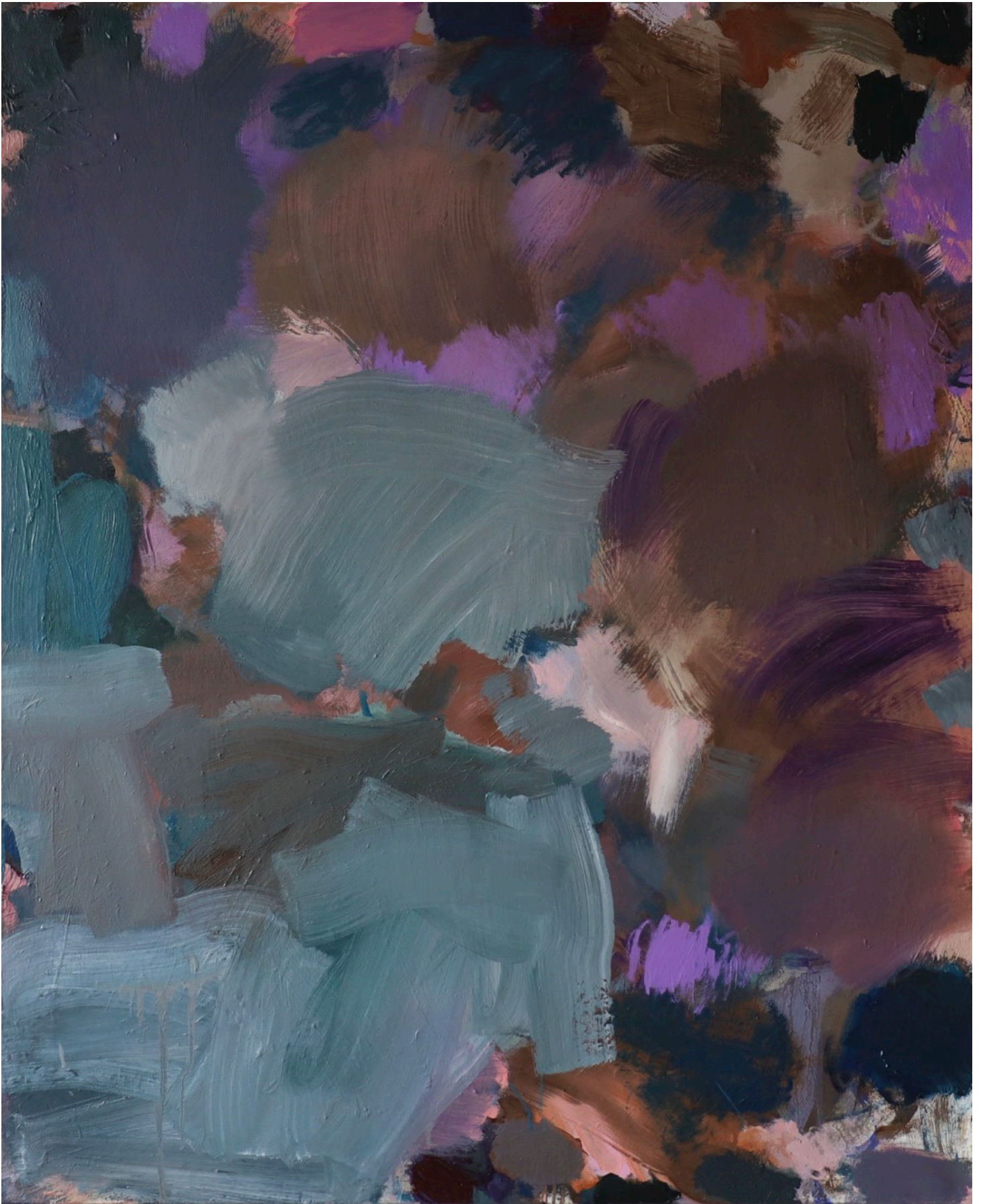
Forest , série des Atmosphériques, 2022, 100 x 81 cm Huile sur toile de lin préparé 1250 e