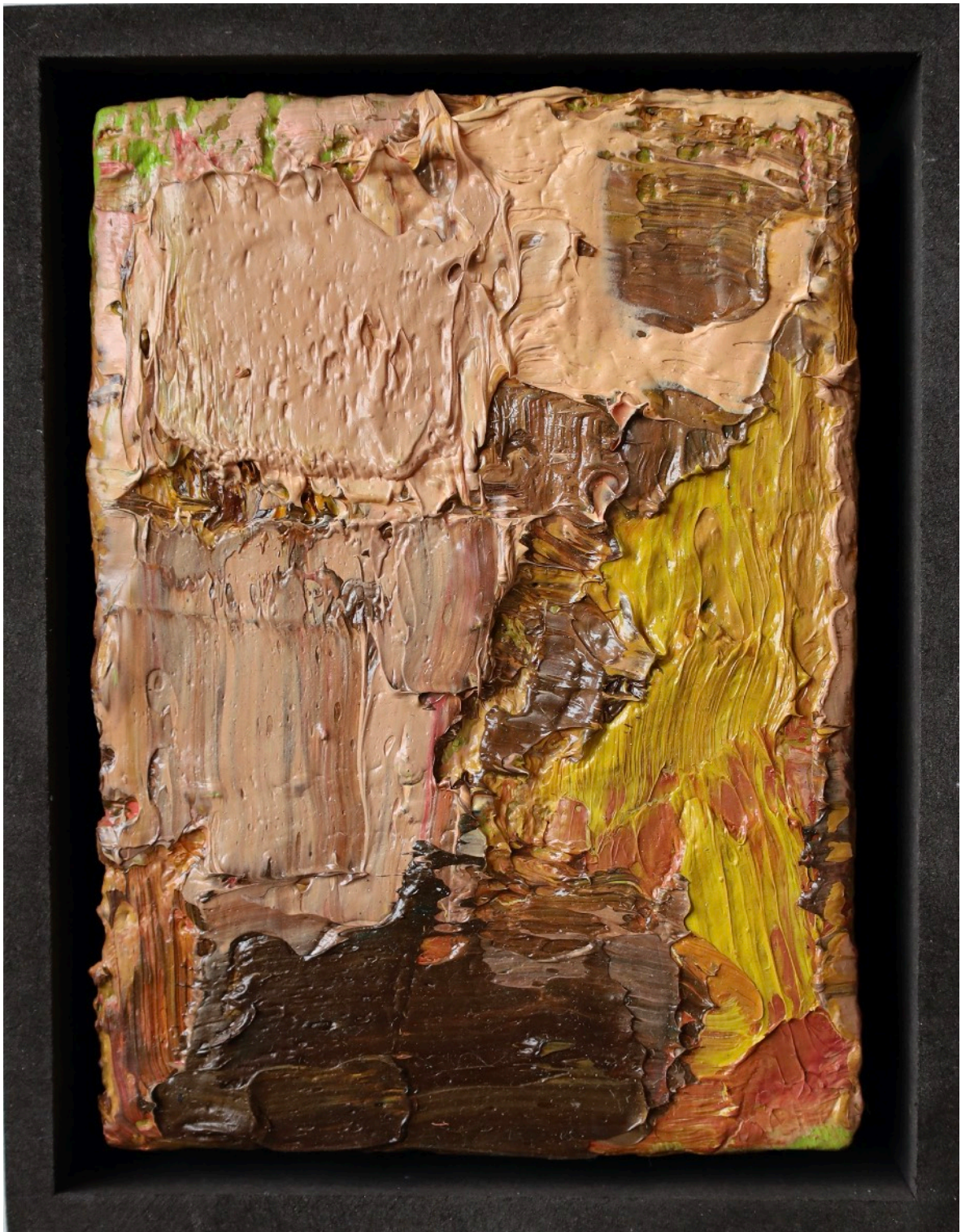
Sans titre , série des Concrétions, 2021-2023 Cadre en médium noir, 16 x 13 cm Huile sur bois de peuplier préparé 300 e