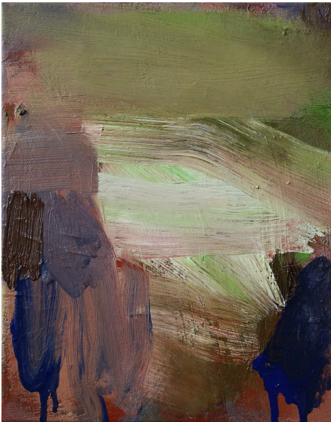
Instants , série des Atmosphériques, 2023 24 x 30 cm Huile sur toile de coton 500 e