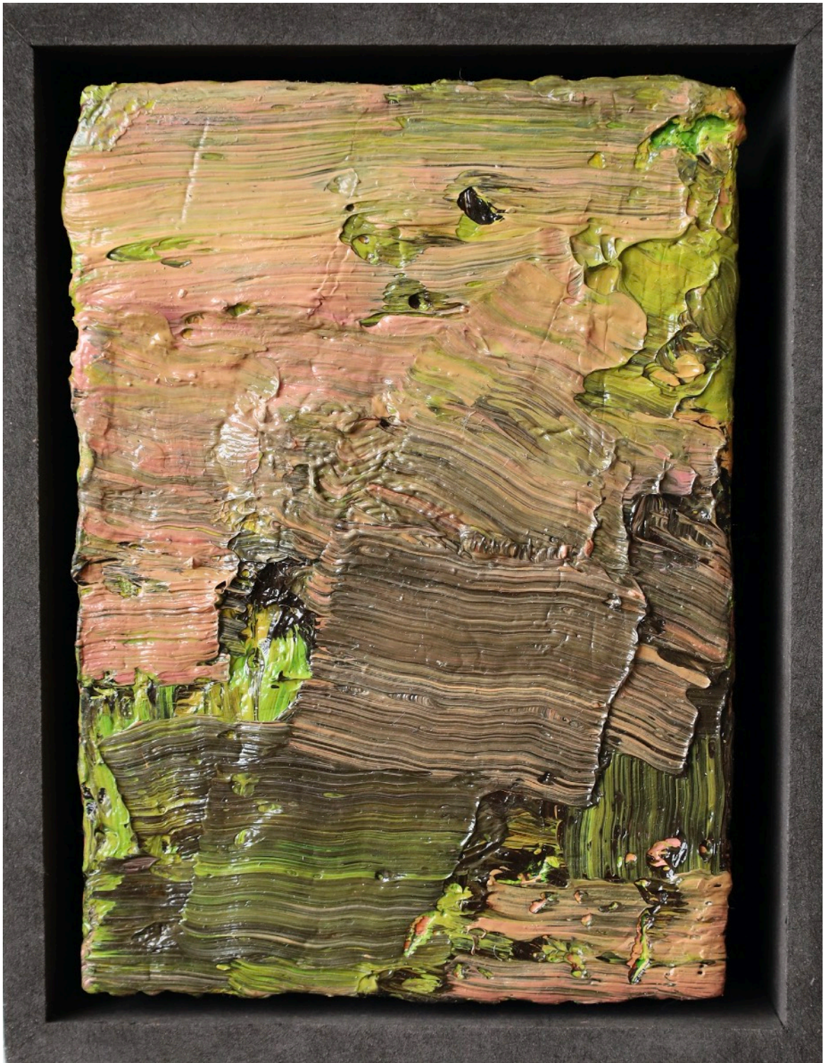
Sans titre , série des Concrétions, 2021-2023 Cadre en médium noir, 16 x 13 cm Huile sur bois de peuplier préparé 300 e