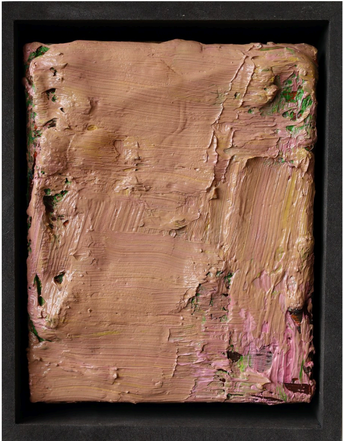
Sans titre , série des Concrétions, 2021-2023 Cadre en médium noir, 16 x 13 cm Huile sur bois de peuplier préparé 300 e