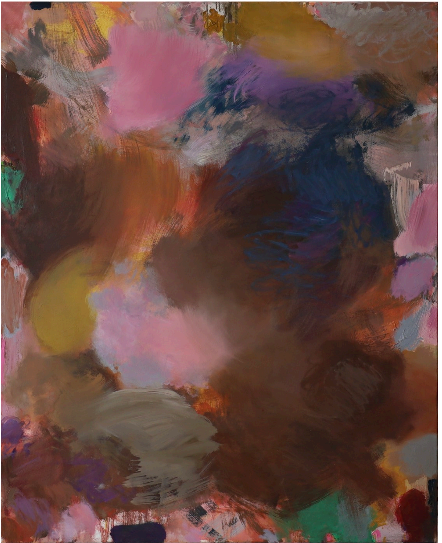
Earth-Sky (brown) , série des Atmosphériques, 2022, 100 x 81 cm Huile sur toile de lin préparé 1250 e