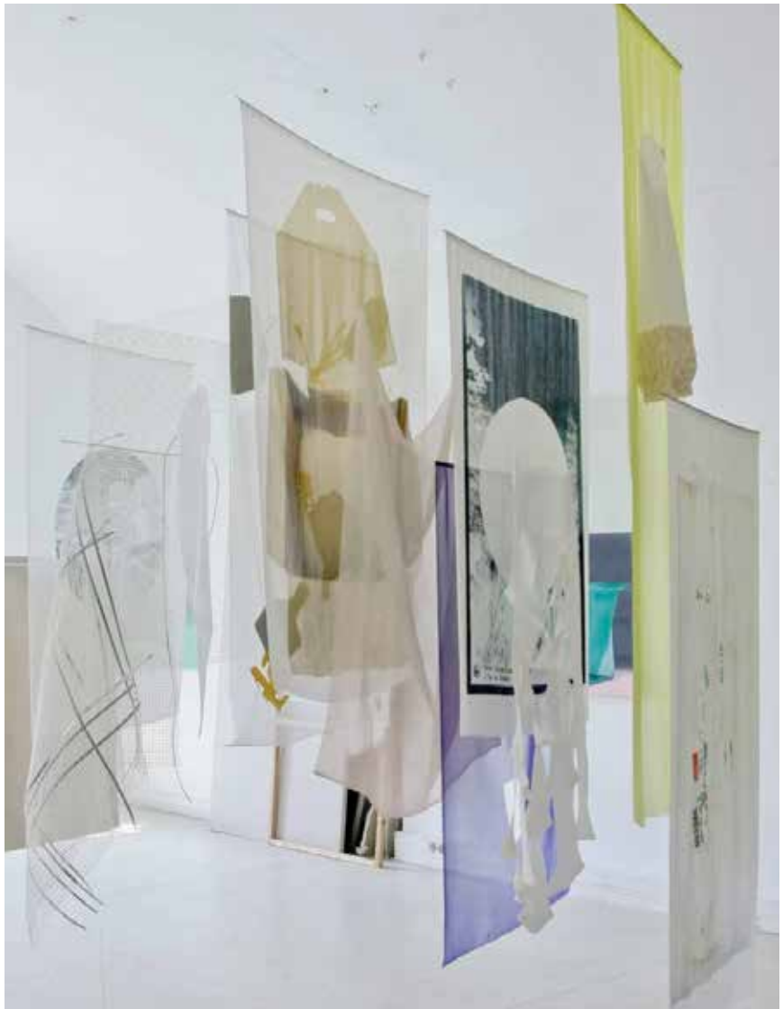
Installation impression de photo sur polyester, matériaux textiles divers, dessin sur papier calque 100 cm x 200 cm x 280 cm 2019