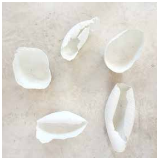
21 cm x 13 cm environ porcelaine papier Prix : 100 € par porcelaine