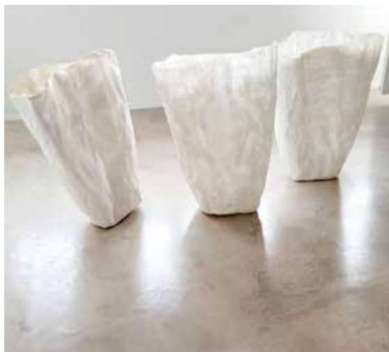
3 vasques Papier de soie collés