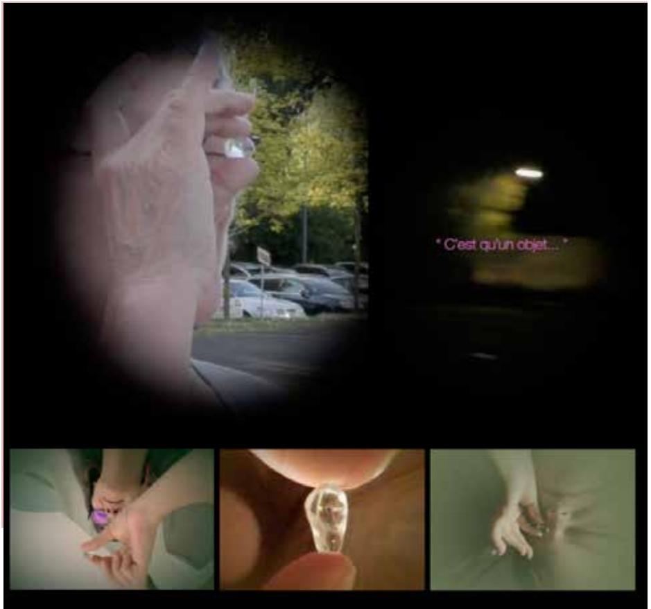
Format : 1920x1080 pixels Technique : Vidéo (audiovisuel)