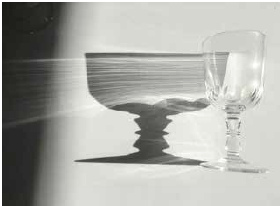
Tirages 30/30 cm 85 euros pièce